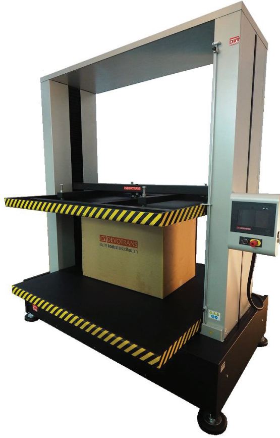
DVT FU D S150 N

ÖZELLİKLE AMBALAJLI BEYAZ EŞYALARIN, BÜYÜK ÇAPLI BORULARIN EZİLME, KIRILMA, ESNEME DENEYLERİ İÇİNDİR